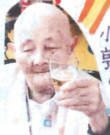
小柄な亭子さんビールが大好きです!

1月6日、新たな年の始まりを祝し、潮亀神社を目の前にし、恒例の新年会が行われました。