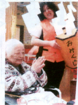
ミサヲさんは何をお願いしたのでしょうか