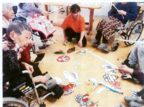
釣った魚のうらにはお題が書かれています