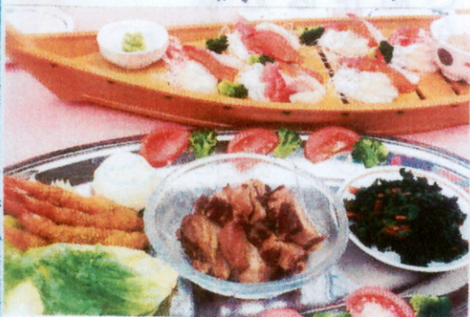
エビフライ 豚の角煮 ほうれん草のごま和え