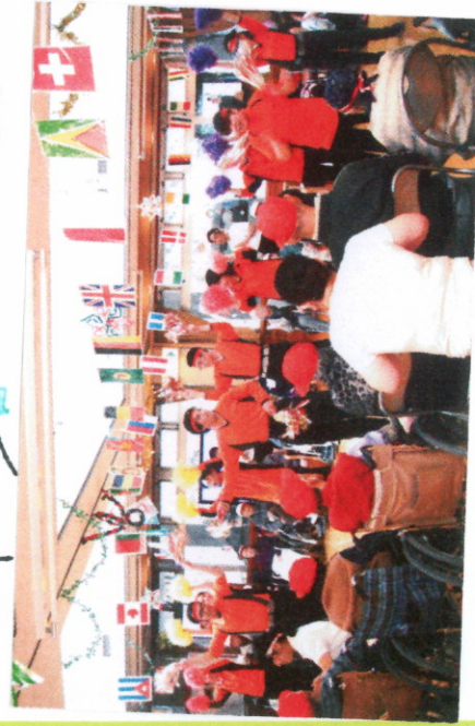
赤組の応援合戦 せんべいに夢中で 車はそこないサミヤ

してくれましたが、二戦交え両方赤組が勝利し、白組逆転ならず赤組が運動会の勝者となりました。 競技の後は、日新小学校の皆さんからの