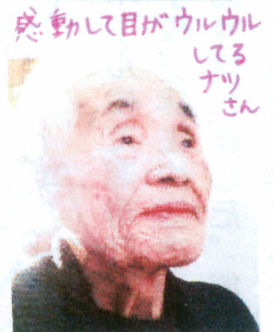
感動して目がウルウルしてるナツさん