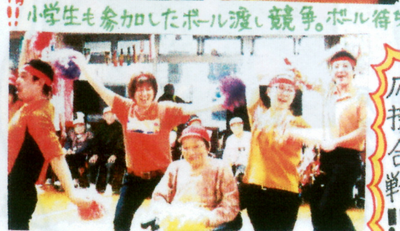
小学生も参加したボール渡し競争。ボール符です。