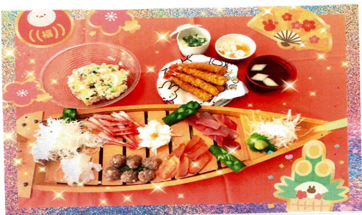
舟盛りに乗った豪華なお刺し身でした。