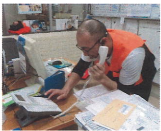
みなさんホールへ避難です!