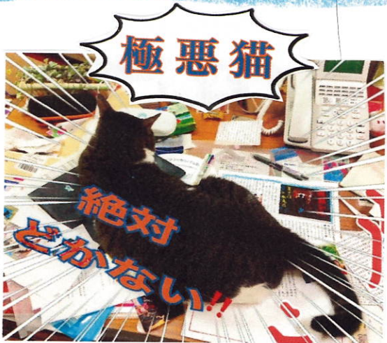
潮寿荘だよりの編集妨害に机に居座る・尻尾で原稿飛ばす etc... 全精力を傾ける億♂

は明るさがあるので施設の中は暗く見えない状態で、その中の避難はかなり難しかったです。部屋のベランダから外に出る時、慌てすぎて車イスが上手く動かせず引っかけたり、すぐに誘導できず時間がかってしまったけど消防署の方や夜勤役の高橋介護士と同じく夜勤役の旦那、鈴木雄也の早い指示と対応と他の避難誘導をしてくれた職員の皆さんのおかげで誰一人ケガ無く避難する事ができました。私は一度焦りすぎてパニックってしまい灯りを付けてしまいました。でも訓練全体は消防署の方達から素晴らしいと褒めて頂き、新聞にも記事になって載ってていてびっくりしました。火事が起こらないように気をつけるのはもちろんの事、これからも入居者さんと職員と共に生活していきたいと思えます。(ネットゲームで出会ったイマドキ夫婦。今は一緒に介護士・鈴木奈)