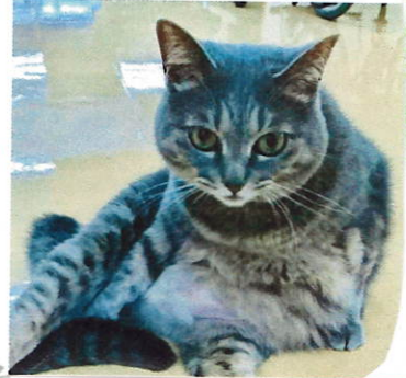
ふだんはカワイイ集ちゃんか...!!