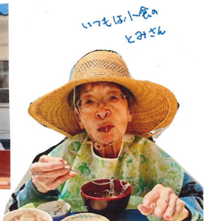
いつも小食のとみさん