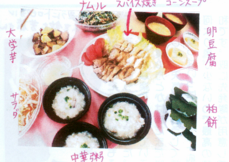
鶏肉のスパイス焼き、中華コーンスープ、卵豆腐、柏餅、大学芋、サラダ、中華粥