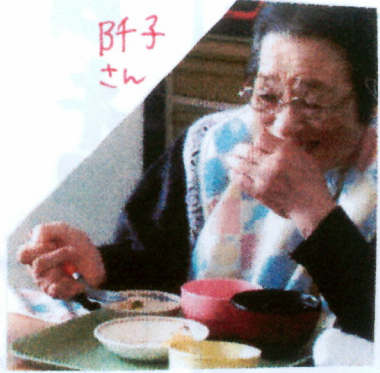
好きなものを好きなだけ食べれるのでみなさん自然と笑顔😊

柏餅は潮寿荘の手作りで、朝から頑張って調理員さんたちが作っていましたが、ある程度ご飯を食べ終わってからも出来上がり、まだかまだかと入居者も職員も首を長くして待ち、何とか食事時間内に間に合いホッとして出来たてを皆さんに食べて頂くことができました。 (車上荒らし&家に泥棒、と最近不運に見舞われてる介護士・尾上)