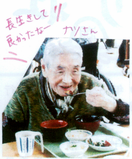
長生きして長がたなナリさん