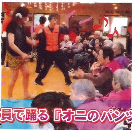
全員で踊る『オニのパンツ』