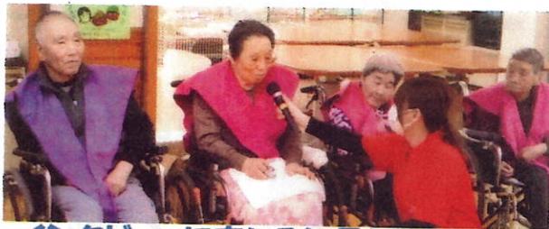
インタビューに応じる年男年女の皆さん