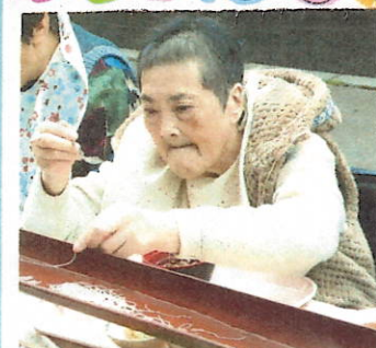
流しがおいしい 真珠様 弘子さん お腹いっぱい 食べました。