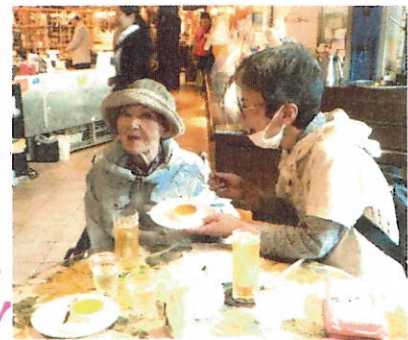
食後のデザートを楽しむ、明子姉妹