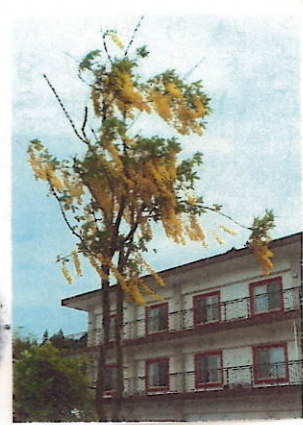
藤棚横ではキングサリも満開 (金鎖・南の国の木だそうです)