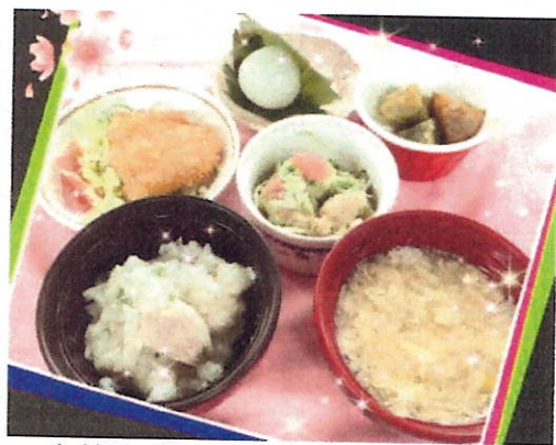
中華粥・卵スープ・白身魚のフライ ・大学芋・サラダ・柏餅