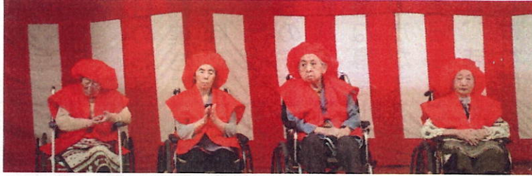
日寿子さん 喜寿子さん 米寿子さん 白寿子さん

9月19日 土曜日、 毎年恒例、 年に一度 の敬老会 が開催さ れました 90歳以上、 喜寿、米 寿、白寿 の入居者 は24名と ほぼ半数 の方が主 役となり