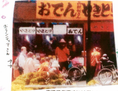
車椅子を押すには厳しい キツ〜い上り坂

平成27年6月15日発行 発行：特別養護老人ホーム 潮 寿 荘 記事：6月担当潮寿荘職員 編集：潮寿荘だより編集委員 題字：福嶋 和子(75歳)