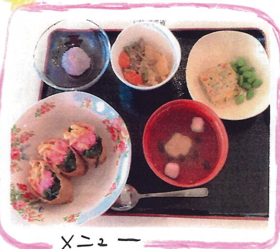
メニュー ・三色いなり ・お吸い物 ・干草焼き ・桜もち ・肉じゃが