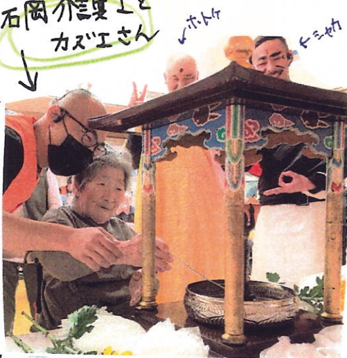
真剣に甘茶をかけ手を合わせていました