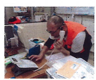
みよさん ホールへ避難す!