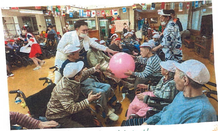
ボールを使ったゲーム!!